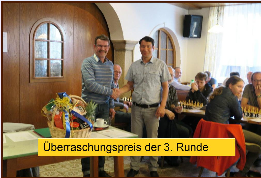
Überraschungspreis der 3. Runde